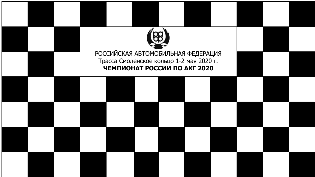
Рисунок 1. Задник подиума (пример)